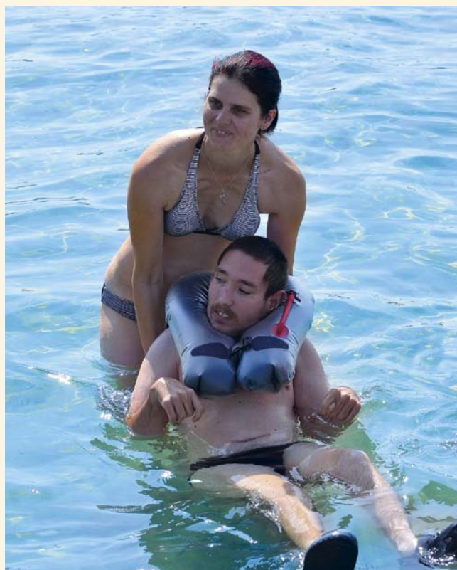
POBYT U MOŘE