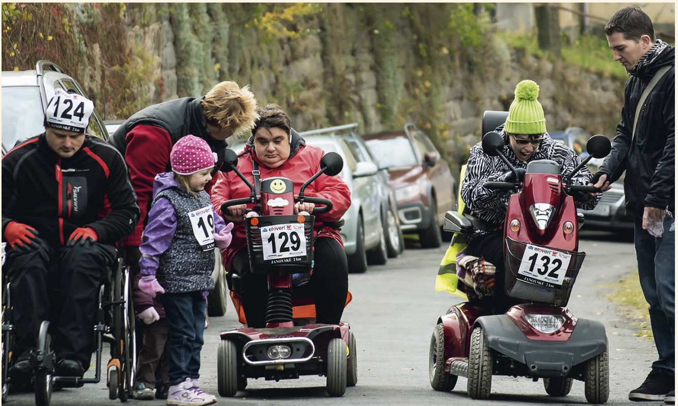
ČSOB JANOVSKÝCH 11 a 19km ELEVEN